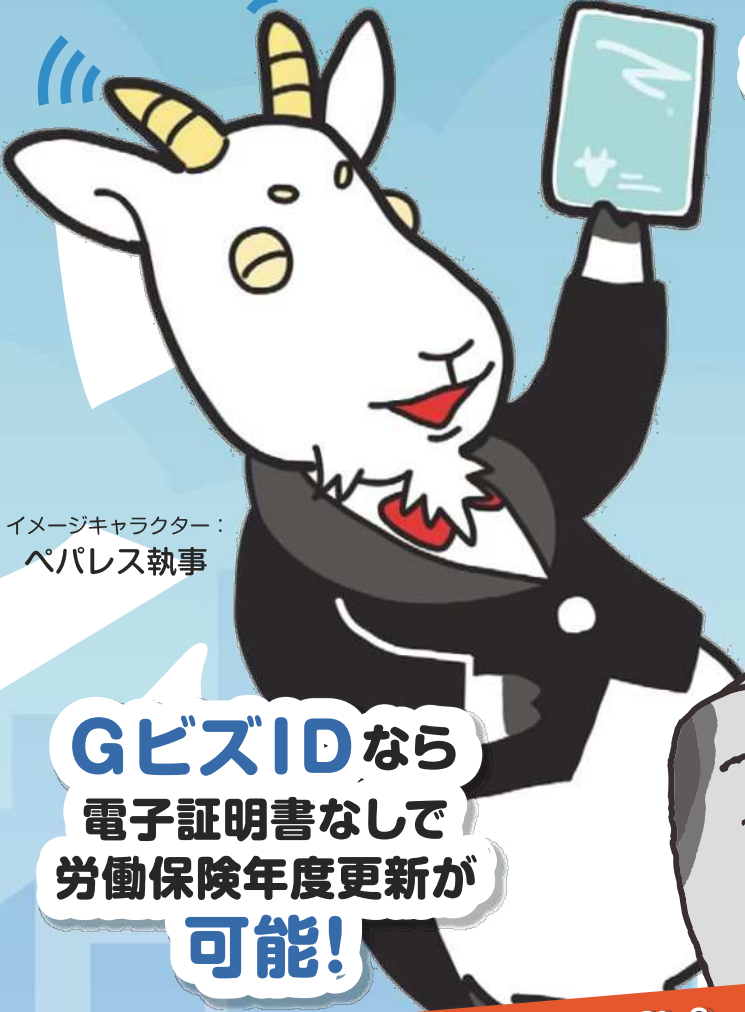
イメージキャラクター： ペパレス執事