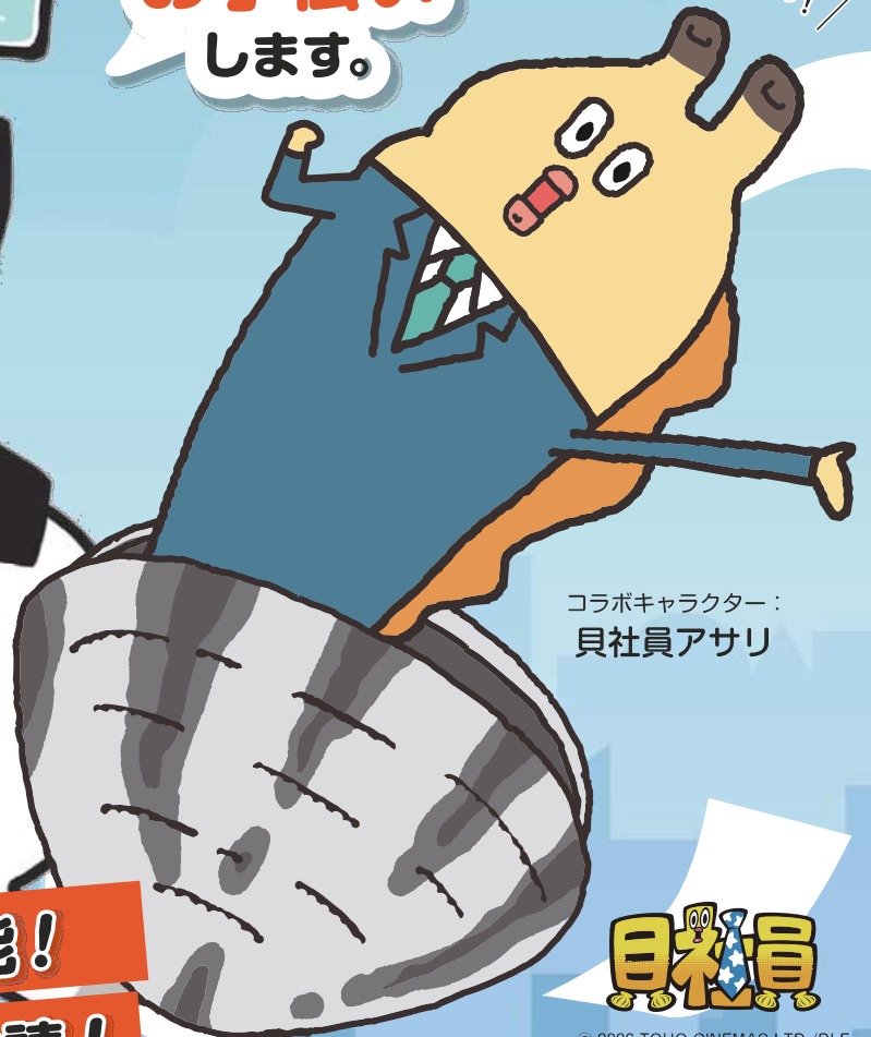
コラボキャラクター： 貝社員アッサリ